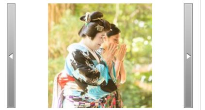
OFUKU THE MOVIE